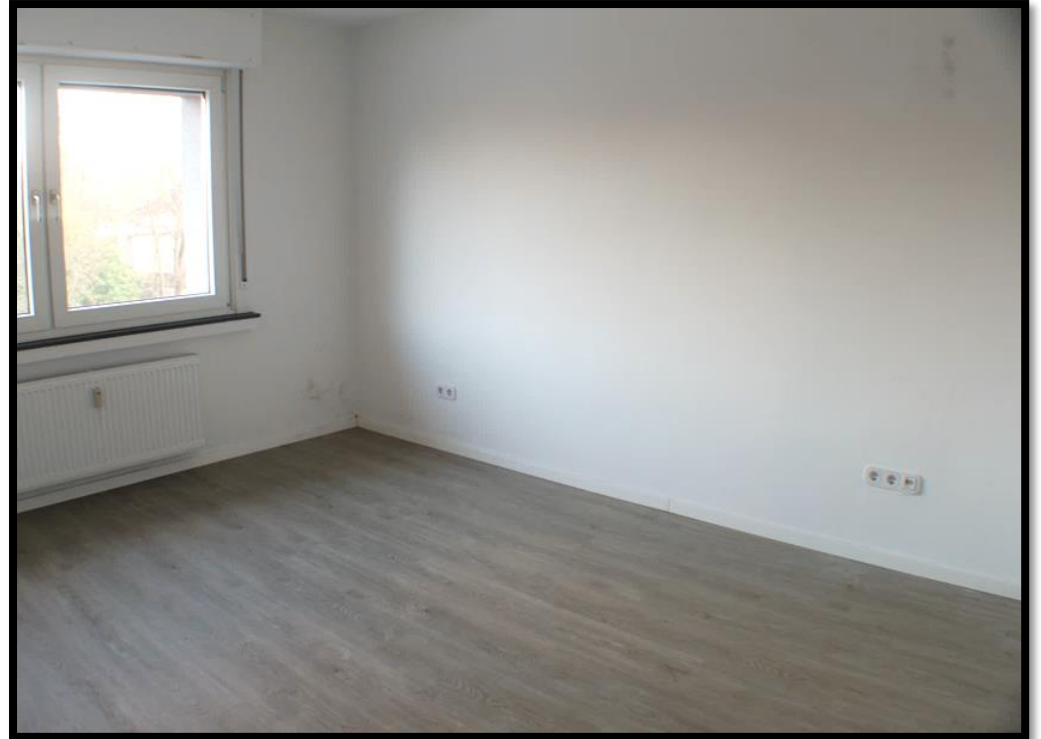
Diele und Schlafzimmer