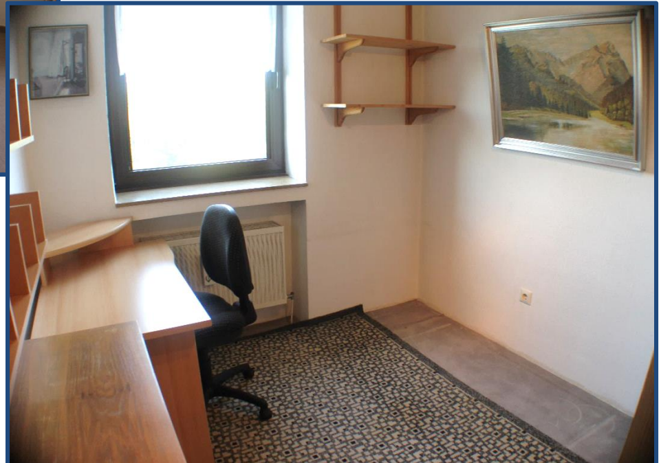
Kinderzimmer / Büro