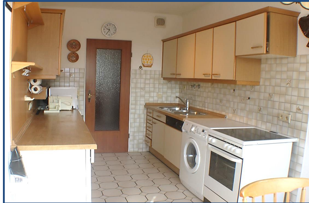
Küche und Essbereich